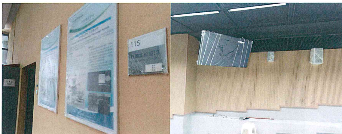
电视、音箱、宣传画等的保护