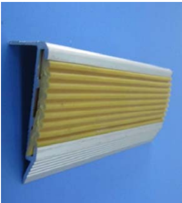
踏步用金属防滑条样式